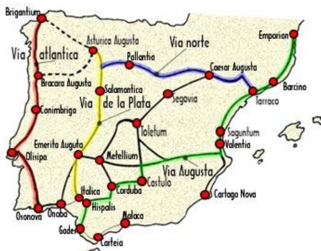
Emerita Augusta en la Vía de la Plata