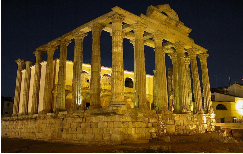
Templo de Diana