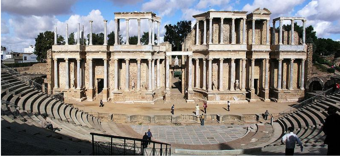
Frons scaenae del Teatro Romano