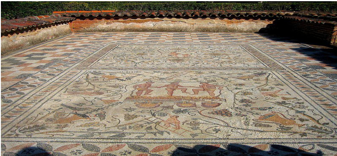
Mosaico de la Casa del Anfiteatro