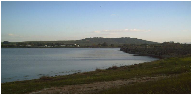
Embalse de Proserpina