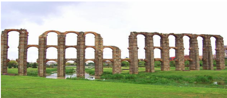
Acueducto de Los Milagros