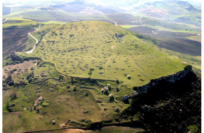
Mesa de Acinipo

Las excavaciones arqueológicas indican que Acinipo fue ocupado por primera vez en la Edad del Cobre (3000 a.C.). En los siglos IX y VIII a.C. el lugar entra en contacto con los fenicios establecidos en la costa de Málaga. A finales del siglo VII a.C. Acinipo es abandonada y la población se establece en la cercana Silla del Moro, para volver a reocupar la mesa a lo largo del siglo V (época ibérica). La presencia romana a partir del año 206 a.C. conllevó grandes cambios, tales como la construcción de edificios monumentales y la acuñación de moneda propia, que muestra espigas y racimos de uvas, símbolos de la prosperidad de la ciudad. Convertida en municipio romano, fue citada por autores clásicos como Estrabón y Plinio. A partir del siglo III d.C. Acinipo entró en decadencia, sustituida en su función administrativa por la cercana Arunda (la actual Ronda). No obstante, la mesa continuó ocupada hasta época medieval, momento en que las ruinas del teatro fueron reutilizadas como torre vigía.