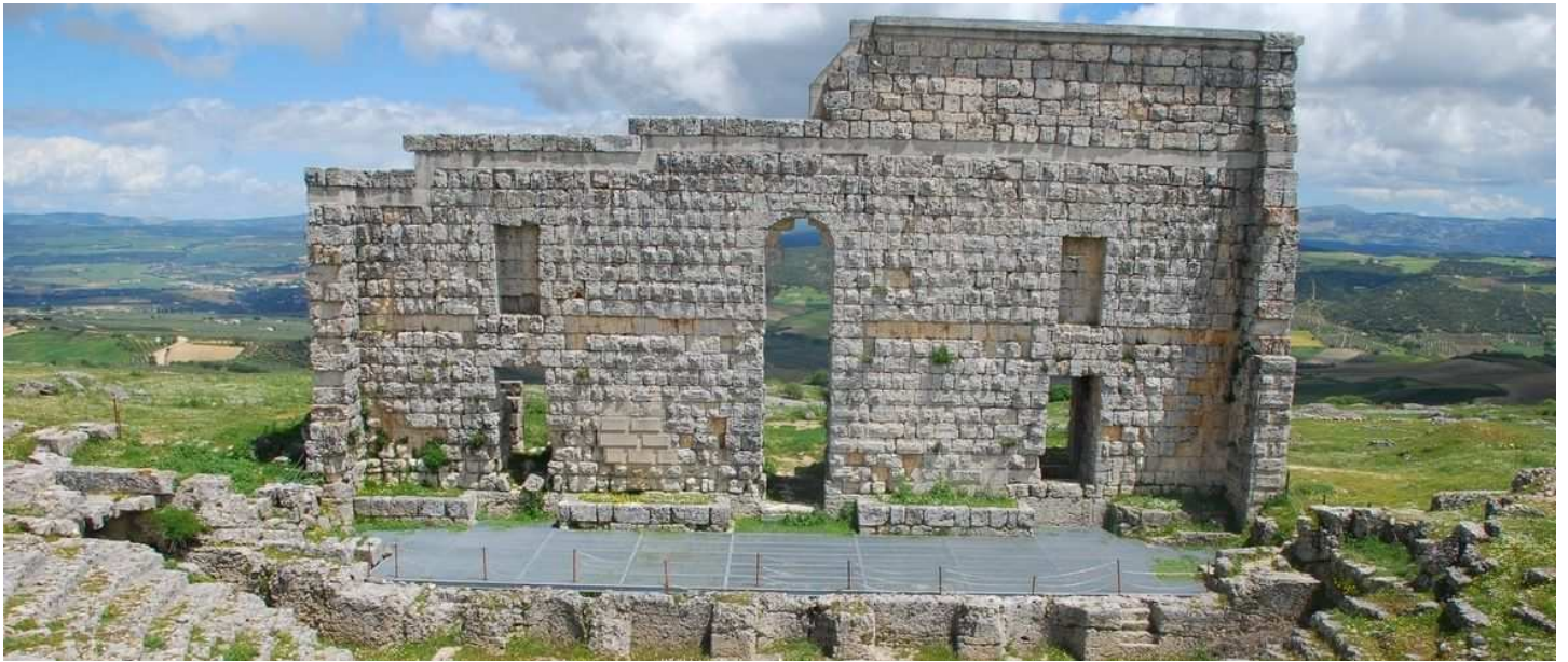
Teatro Romano de Acinipo